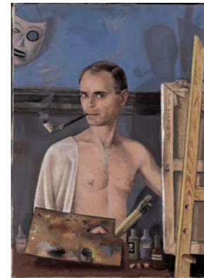
Zelfportret aan de schildersezel, 1943, Felix-Nussbaum-Haus Osnabrück, Bruikleen Niedersächsische Sparkassenstiftung