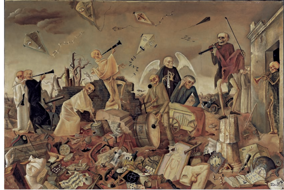
Triomf van de dood, 1944, Felix-Nussbaum-Haus Osnabrück, Bruikleen der Niedersächsischen Sparkassenstiftung

In zijn »Zelfportret aan de schildersezel« uit 1943 laat hij dat bijzonder duidelijk zien. Hij schildert dit kort voor zijn dood. Nussbaum presenteert zich in zijn zelfportret als schilder, die alle attitudes en sluiers heeft afgelegd: koel, zelfbewust en ontspannen. Ondanks zijn diepe melancholie is hij zeker van zichzelf en hoopt op de onsterfelijkheid van zijn schilderijen. Het grote aantal zelfportretten dat Nussbaum schilderde maakt duidelijk hoe onontbeerlijk de zelfbewuste blik op zijn kunstenaar-zijn was voor de bepaling van zijn eigen plaats in de wereld. In de »dialogo« met zijn spiegelbeeld legt Nussbaum verantwoording af over zichzelf – en confronteert de kijker met een ongeveinsde blik in zijn innerlijk.