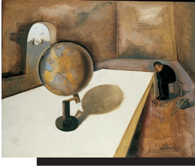
De vluchteling (Europese visie), 1939 Felix-Nussbaum-Haus Osnabrück, Bruikleen Irmgard Schlenke