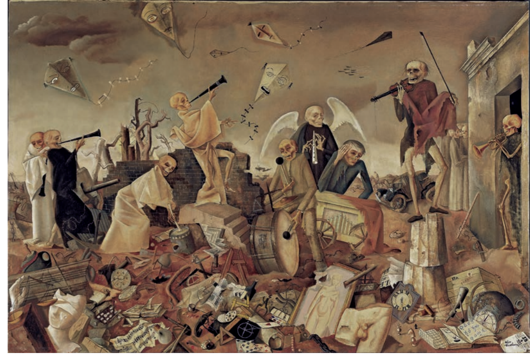
Triumph des Todes, 1944, Felix-Nussbaum-Haus Osnabrück, Leihgabe der Niedersächsischen Sparkassenstiftung

Besonders deutlich zeigt er dies in seinem »Selbstbildnis an der Staffelei« aus dem Jahr 1943, gemalt kurz vor seinem Tod. Nussbaum präsentiert sich in seiner Selbstbetrachtung als Maler, der alle Attitüden und Verhüllungen abgelegt hat: kühl, selbstbewusst und entspannt. Trotz seiner tiefen Melancholie ist er seiner selbst sicher und hofft auf die Unsterblichkeit seiner Malerei. Die große Zahl der Selbstbildnisse, die Nussbaum malte, zeigt, wie unentbehrlich der selbstbewusste Blick auf das Künstler-Ich zur Bestimmung des eigenen Standortes war. Im »Zwiegespräch« mit seinem Spiegelbild legt Nussbaum Rechenschaft über sich selbst ab – und konfrontiert den Betrachter mit einem unverstellten Blick in sein Innerstes.